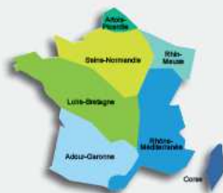
Les 7 bassins hydrographiques métropolitains

Des réussites comme la protection des captages ainsi que l'aide à la conversion au bio et à la réduction des pollutions domestiques notamment sont des avancées dans la poursuite des objectifs DCE.